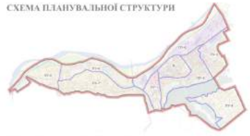
СХЕМА ПЛАНУВАЛЬНОЇ СТРУКТУРИ